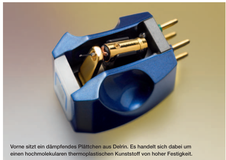
Vorne sitzt ein dämpfendes Plättchen aus Delrin. Es handelt sich dabei um einen hochmolekularen thermoplastischen Kunststoff von hoher Festigkeit.