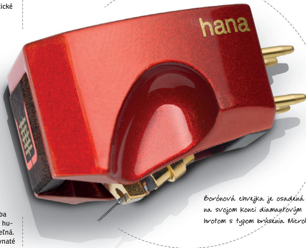
Borónová chvejka je osadená na svojom konci diamantovým hrotom s typom brúsenia Microline

Hana Umami Red je skvelá prenoska určená pre tie najnáročnejšie snímacie systémy a dokáže splniť požiadavky aj toho najfajnovšieho poslucháča. Jej zvuková kvalita sa už nachádza v oblasti kvality absolútnej, kde ani priplatenie niekoľko tisíc euro nemusí znamenať zásadný prínos v kvalite reprodukcie. Jej pomer ceny a výkonu ju teda stavia na úplný vrchol tohto pomyselného rebríčka. ❌