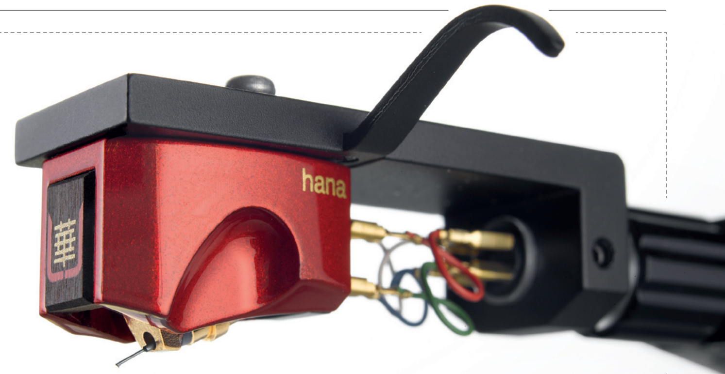
HANA UMAMI RED

Balenie prenosky s cenou atakujúcou 4 000 eur je viac ako spartánske, väčšina z nás by očakávala minimálne lakovanú kazetu s ručným zdobením s podpísaným certifikátom od toho „najvyššieho“. Nie je tomu tak. Umami Red je dodávaná v jednoduchej nelakovanej drevenej krabičke, ktorá okrem samotnej prenosky obsahuje len